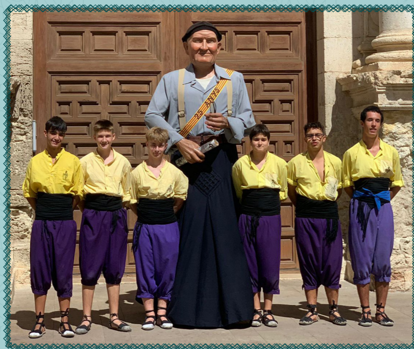
Portadors actuals del gegantó Gumersind