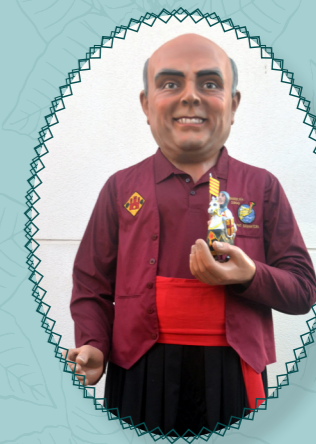
Josep Torrella Olivé Barberà del Vallès Construït el 2021