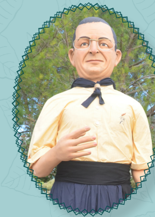
Marcel Rodríguez Bramón Salt Construït el 2003