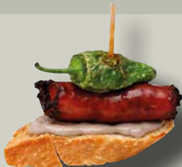
Xistorra brava amb allioli de cirera