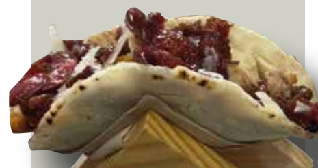
Taquicherry Tortita de pollastre amb cirera

- El tapòdrom es podrà recollir en tots els establiments participants i també a l'estand de l'Ajuntament situat a la plaça Major.