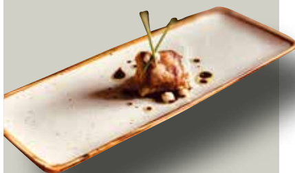
Cruixent de secret i pernil ibèric amb ceba caramelitzada

(solament disponible dissabte 6 de juny)