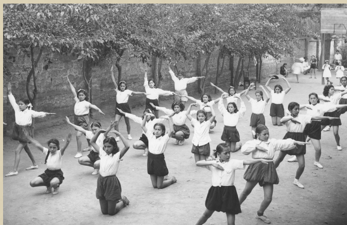
Jocs Olímpics de Londres. 1908.