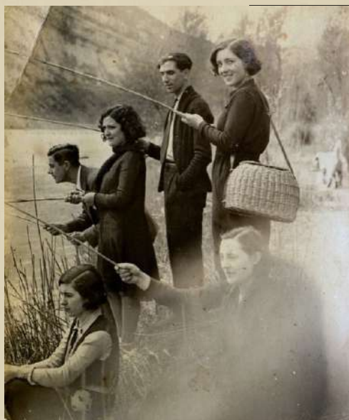
Tarda de pesca al riu Llobregat. 1931.