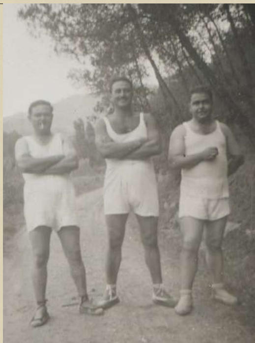
Homes vestits amb roba d'atletisme. 1950.