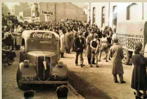
Sortida del Cross Sant Vicenç de Castellet - Manresa davant del bar Bonavista. Anys 40.