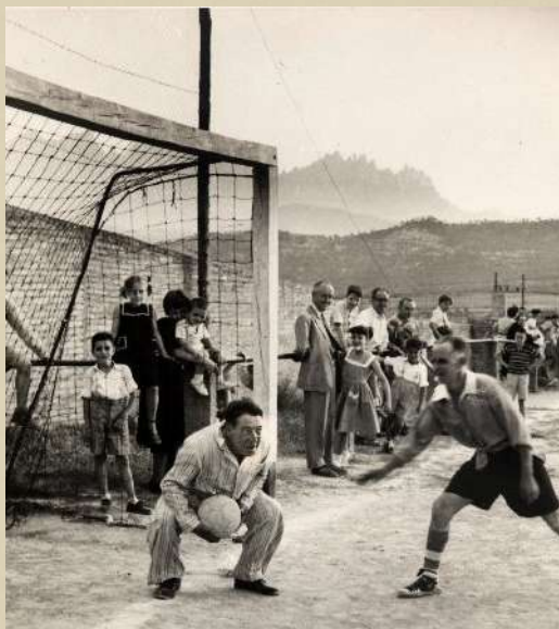
Camp Municipal Les Roques. 1955.