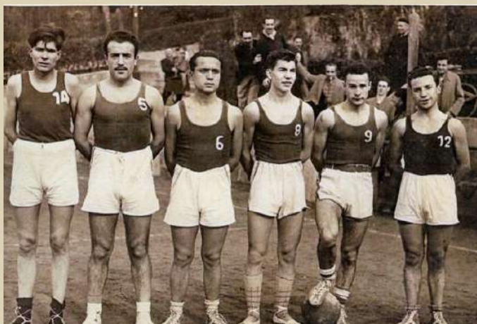
Equip de Futbol. 1951.

Paral·lelament, l'activitat esportiva es diversificava. El ciclisme ja comptava amb una notable afició a inicis del segle XX, amb curses locals documentades abans de la construcció del pont el 1923. En aquest context sobresurt