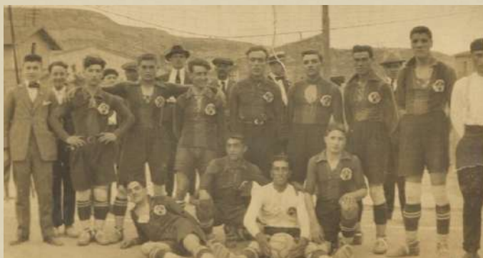
Equip de Futbol de Sant Vicenç de Castellet al Camp Les Roques. 1957.