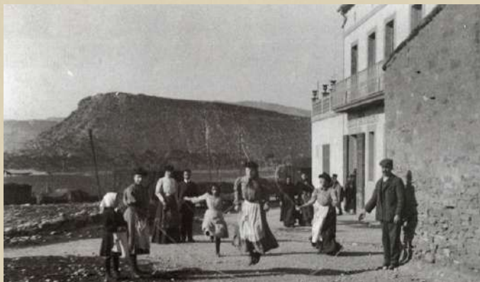
Dones i nenes saltant a corda. 1906.

Així, la història de Sant Vicenç de Castellet evidencia com el progrés industrial i tècnic va anar acompanyat d'un fort teixit associatiu i esportiu. Una herència que forma part del seu patrimoni immaterial i que encara avui defineix el caràcter i la vida social del municipi.