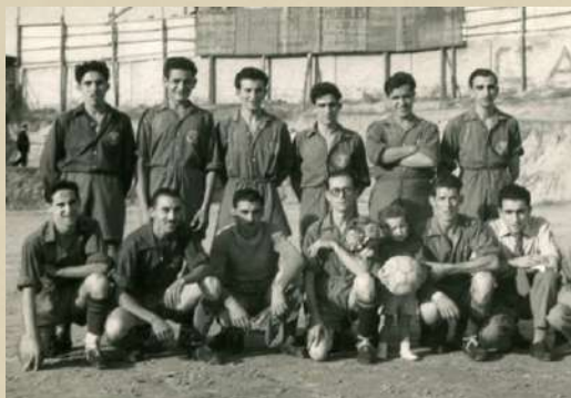
Camp Municipal Les Roques. 1955.