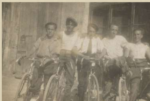
Santvicentins en bicicleta. 1931.