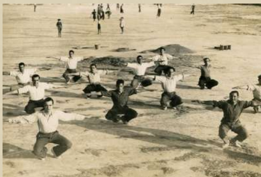
Camp Muntelpal Les Roques. 1935.

Organitza: Associació Sempre Dones Plaça de l'Ajuntament