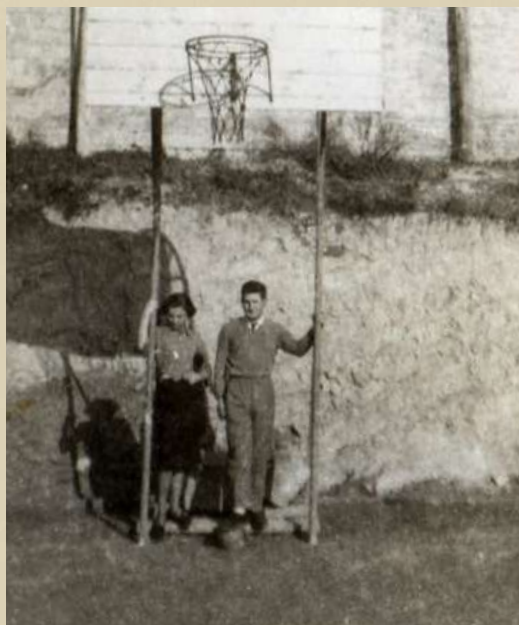
Inauguració de la pista de basquet.