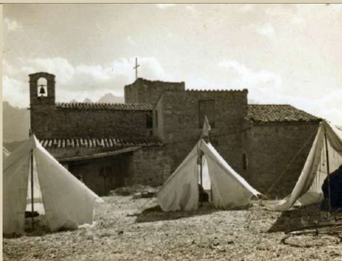
Heampada a Castellet. 1955.

L'impuls definitiu arribà amb la construcció del Camp Municipal d'Esports. Iniciat el 1925 en uns terrenys irregulars de l'Arrabal de las Rocas, el projecte es dugué a terme gràcies a l'esforç col·lectiu de veïns i jugadors, que treballaren intensament per fer-lo realitat. El camp s'inaugurà el 2 d'octubre de 1926, però les dificultats econòmiques van portar a la seva cessió a l'Ajuntament, que des d'aleshores n'ha garantit la continuïtat.